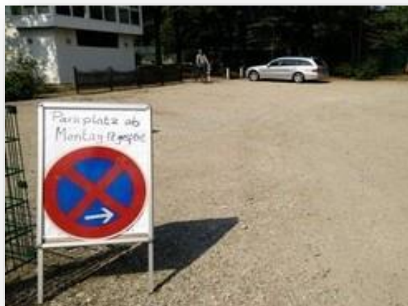
Parkplatz für die Fa. Courtec gesperrt

Am Montag den 17. August rückte die „Platzsanierer“ Firma Courtec an: