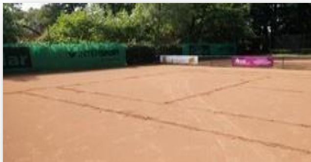
Alte Linien herausnehmen