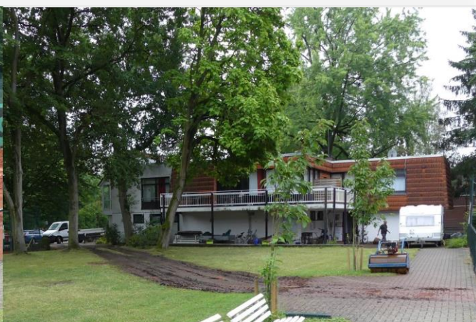
Befahren durch Bagger hinterlässt Spuren

In den ersten zwei Tagen wurde die Tennendecke komplett abgetragen. Wir brauchten 15 Container, um den alten Rotsand abtransportieren zu lassen. Die Tennendecke war zwischen 6-8 cm dick und ließ nur wenig Wasser durch. Die