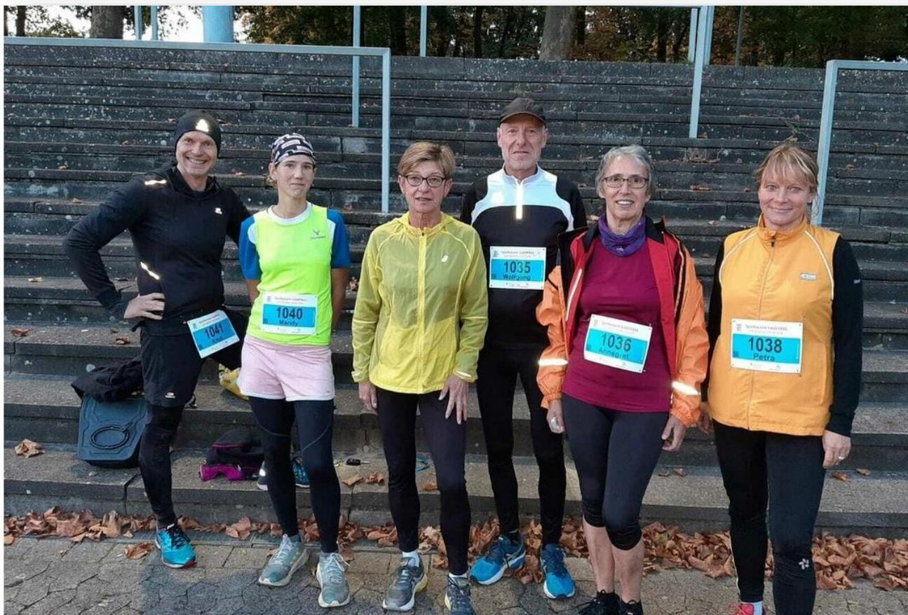
4 km im Stadion